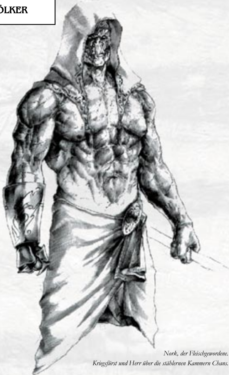
Nork, der Fleischgewordene. Kriegsfürst und Herr über die stählernen Kammern Chans.

Willkommen, Wanderer! Seit herzlich willkommen in den Reichen einer uralten, umkämpften Welt namens MONDAGOR, die sich nach Jahrhunderten der Kriege und Schlachten einem trügerischen Frieden genähert hat. Doch bereits jetzt werfen beunruhigende Ereignisse ihren dunklen Schatten auf die kommenden Jahre. Ihr werdet sehen, spüren, erleben.