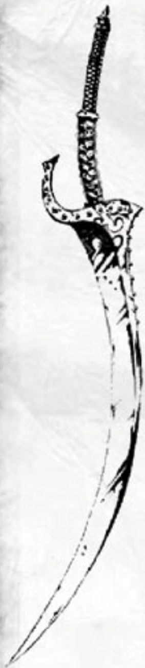
Kloner Sichel Die mit Gold und Smaragden verzierte Klinge von Ajla'Sbar, der ersten Leib- wächterin Egeas.